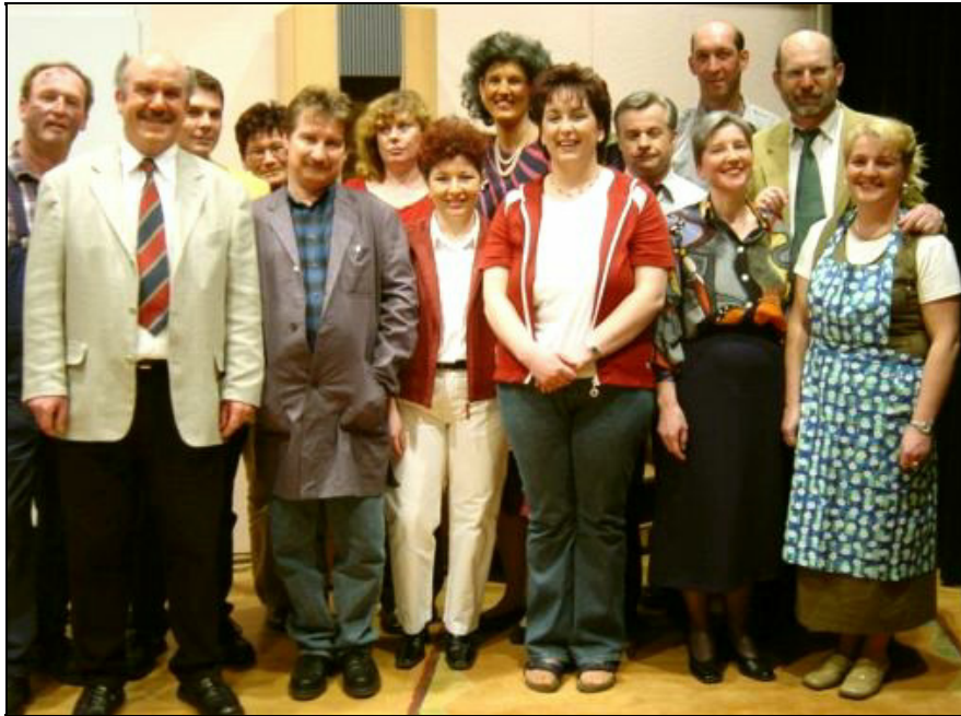
Die Theatergruppe nach der Aufführung „Reine Nervensache“, 2004